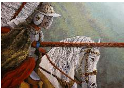
Izabela Błasińska, Furia , akryl