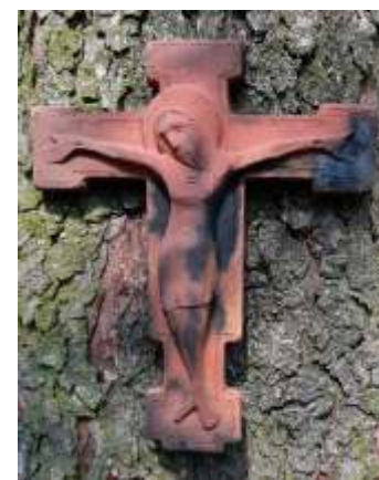
Wojciech Kostecki, Ukrzyżowanie 5 ARCHE Ziemia Woda Powietrze Ogień Człowiek , ceramika, glina szamotowa, biskwit, wypał w piecu opalanym drewnem