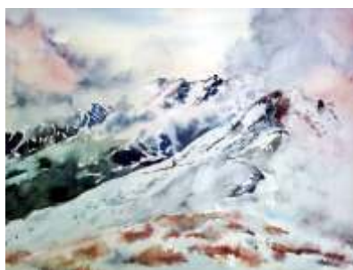
Jolanta Wawer, Tatry , akwarela