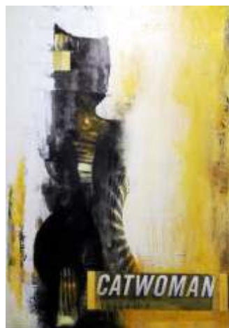
Anna Skowronek Catwomen akryl na papierze, kolaż