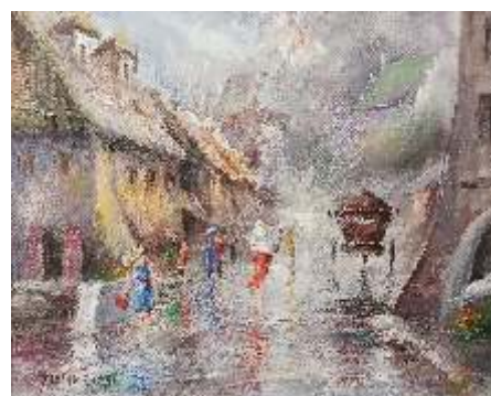
Ziemowit Jastrzębski, Kazimierz w deszczu - ul. Lubelska , olej