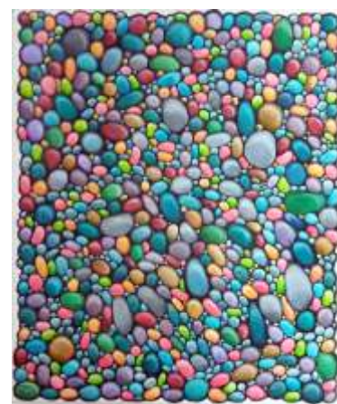
Anna Turska, Kamienie jak ludzie , olej