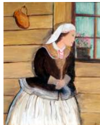
Kazimiera Szklarz, Góralka , olej