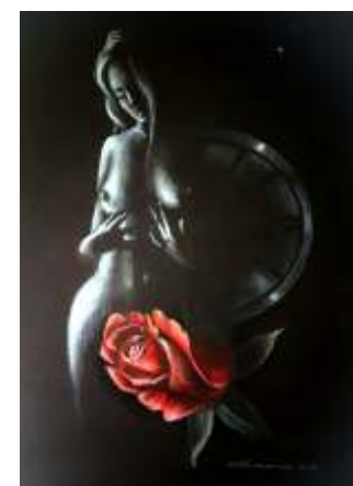
Tigran Haszmanian, Noc , kredki pastelowe