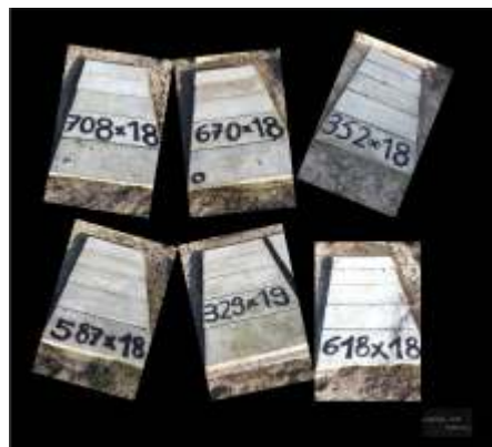
Wacław Dutkiewicz, Loteryjka 2021 , fotografia, wydruk