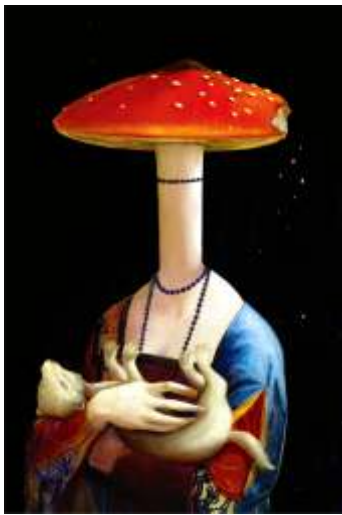
Justyn Parfianowicz, Bez tytułu , digital painting / print