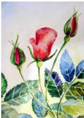
Elżbieta Osińska, Róża , akwarela