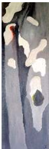
Lucyna Kowalik, Platanus z cyklu Drzewa Australii , olej