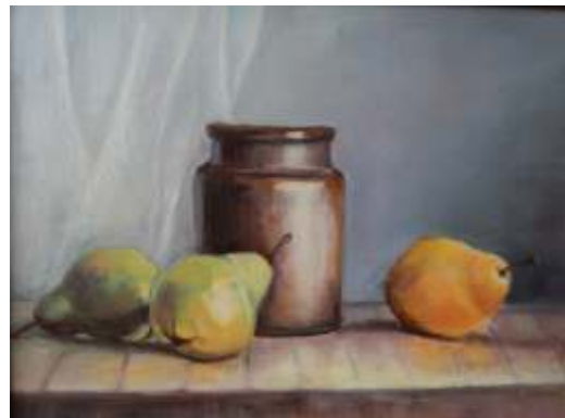
Renata Stepień, Martwa natura , olej