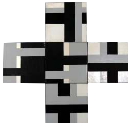
Zbyszek Kosowski, 2020, olej