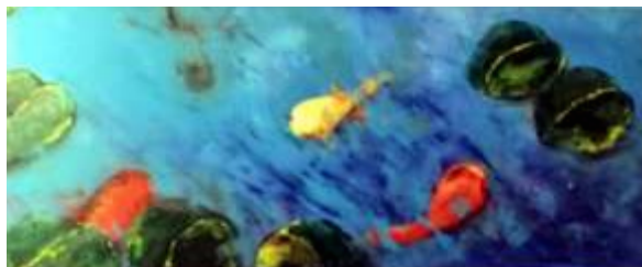
Dorota Leonienko, Ryby , akryl