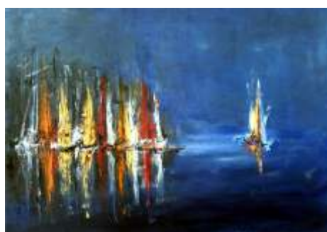
Aleksandra Pawłowska, Morskie opowieści , olej