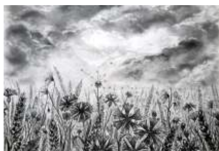
Agnieszka Środa, Łąka , rysunek