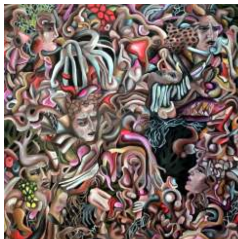
Wiktor Kurpiewski, Wnętrze , akryl