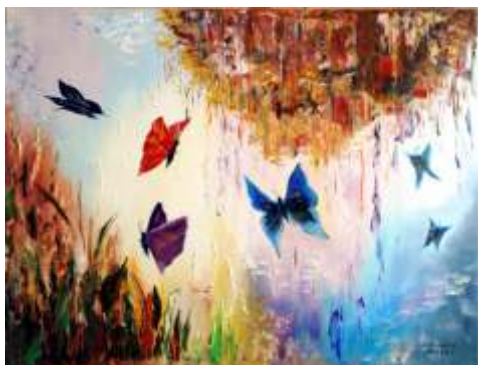
Dariusz Jaskólski, Świat motyli , olej na płótnie