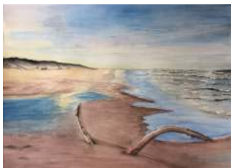
Marzanna Bednarz, Plaża z patykiem , akwarela