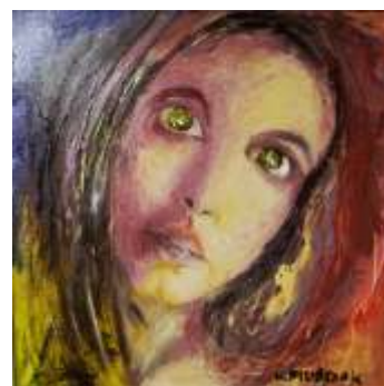
Katarzyna Filipczak (Filka), Zanikanie , olej na płótnie