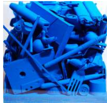
Marzena Czępińska, Blue Trash , akryl na plastikowych odpadach zamknięte w szklanym kubiku