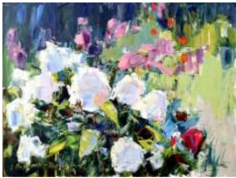
Alena Maksimuk-Przewłoka, Słoneczny ogród , olej