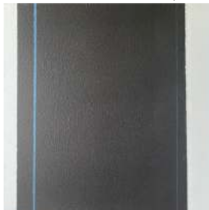
Urszula Ślusarczyk IX/2018 , płótno, mixed media