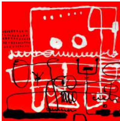
Jakub Pieleszek, Bez tytułu , akryl na papierze