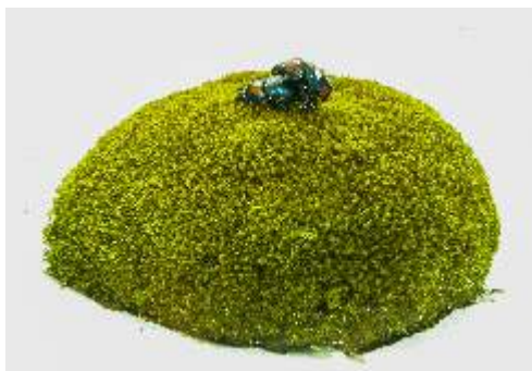
Rafał Czępiński Love , żuki, akryl, mech, szkło