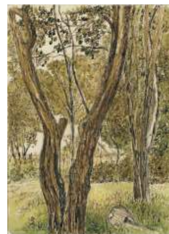
Zbigniew Pielaszek, W ogrodzie ucichł śpiew , akwarela, tusz