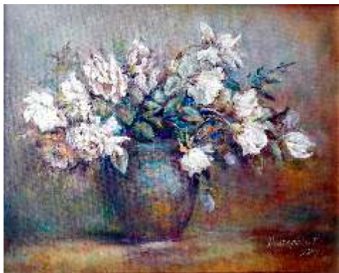
Teresa Dobrzyńska, Róże , olej