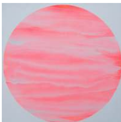
Adam Skóra, Solar 40718 , akryl, płótno