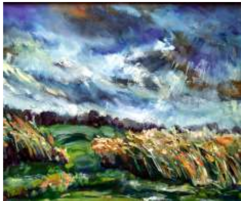
Halina Piórczyńska, Przed burzą , olej