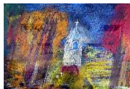
Damian Czerwiński, Kapliczka , pastel suchy